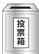
図2 ②比例代表の投票方法