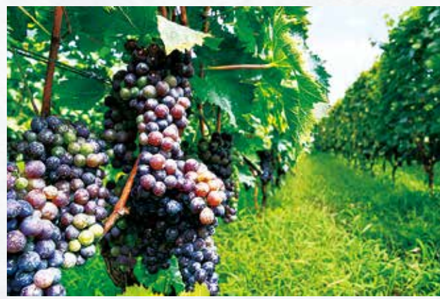
取材したセントクワイナリーでは、市内緑区・中央区にある約7,000㎡の自社農園で13種を栽培している

7月・8月になると実も大きくなり、色づき始める。余分な果実や房を取り除き、収穫に備える