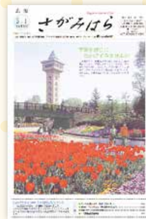
広報さがみはら1000号 (平成14年5月1日号)

リニューアルで紙面も時代とともに進化。この年、相模線上溝駅前広場が完成。小・中学校が週5日制に