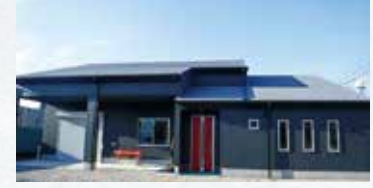
4年11月、醸造所が完成。5年1月にいよいよワイン醸造に着手

市内でブドウ栽培を始めてからワイン完成まで、思い通りにいかないことの連続でしたが、なかなかできない貴重な経験がすることができ、人脈も広がりました。免許取得後、初めて手掛ける相模原ワインは、昨年収穫したブドウを今回のために冷凍保存し、可能な限り手間暇をかけて丁寧に醸造しました。本数は少ないですが、少しでもたくさんの方にワインを味わっていただけたらうれしいです。