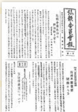
弘報委員会報1号 (昭和24年4月25日号)

最初の広報は ガリ版*刷りでの発行 *ロウを塗った紙に、鉄の筆で直接文字などを書いて版とし、インクの付いたローラーを押し当て印刷するもの