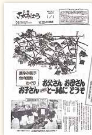
広報さがみはら500号 (昭和56年7月1日号)

写真、図もふんだんに使われた紙面。この年、第1回市民俗芸能大会を開催。「ひばり放送」を運用開始