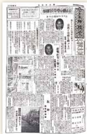
市報相模原100号 (昭和33年12月20日号)

当時はほぼ月1回の発行(昭和45年4月から月2回)。この年、「相模原市民の歌」を制定