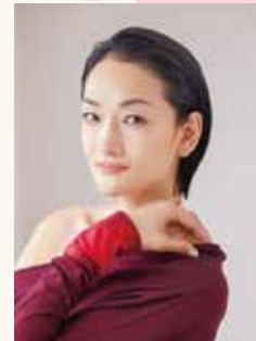
市名誉観光親善大使 富永 愛さん