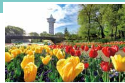
令和2年 イチ押し写真大賞「花の谷」