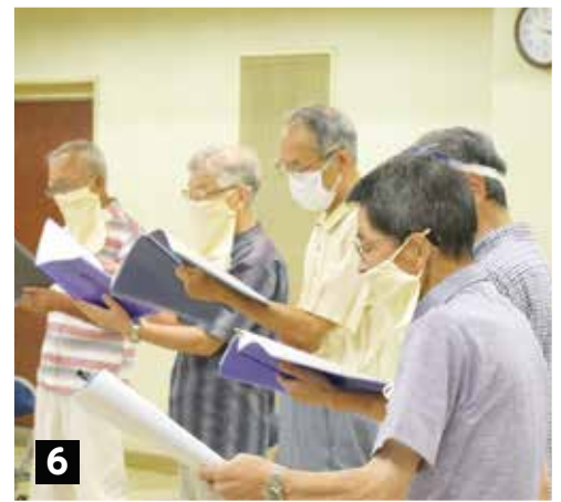
団体名(活動場所/活動頻度) ❶ 富士のせせらぎの会(緑区藤野地区/月2回) 健康体操やゲーム、工作など。送迎あり ❷ 緑寿会 パンポンの会(中央区緑が丘/週2回) 木製のラケットとネットを使うテニスと卓球に似たスポーツを実施 ❸ かがやき(緑区大山町/毎週火曜日) アリオ橋本を会場に、いきいき百歳体操を実施。飛び込み参加も歓迎 ❹ 末広町みんな元気にの会(緑区橋本/月2回) 健康体操と町内ウォーキングのほか、2カ月に1回程度の料理活動を実施 ❺ 御園二丁目サロン(南区御園/毎週月曜日) いきいき百歳体操、健康麻雀、トランプなど ❻ 相模原中央男声合唱団(中央区中央/月2回) 指揮者・ピアニストの指導で合唱 ※撮影のためにマスクを外している場合あり