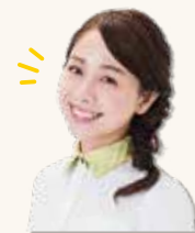
タレント 鈴木あきえ さんも出演