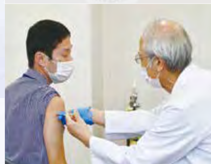
一部の従事者もワクチンを接種。「思っていたよりも痛くなかったです。あっという間に終わりました」

介護老人保健施設「青葉の郷」(中央区青葉)では、施設の運営や感染リスクを考え、従事者も一緒に接種した。訪問接種初日に接種したのは20人で、最高齢は104歳の入所者(写真左)