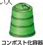
コンポスト化容器

対象容器 家庭用の2,000円を超える生ごみ処理容器 ※非電動式(コンポスト化容器等)は1世帯につき2台まで ※電動式生ごみ処理機は1世帯につき1台まで