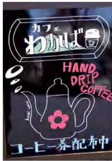
学生の手書き看板