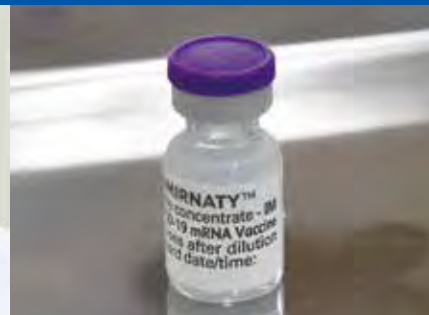
待ち望んでいたファイザー社製のワクチン