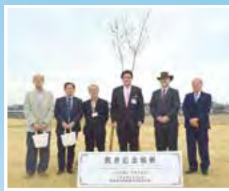
3月25日の植樹の様子