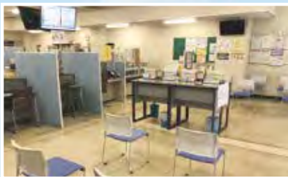
大野北まちづくり センター待合室