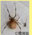
ハイイロゴケグモ

かまれてしまったら ……速やかに患部を水で洗い、医療機関に相談してください。可能であれば、かんだクモの種類が分かるように、殺したクモを医療機関に持参してください。