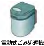
電動式ごみ処理機