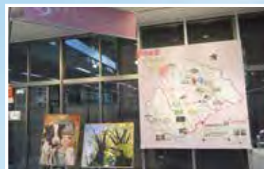
中央区インフォメーションコーナー

区のイラストマップを設置し、季節ごとのイラストや写真を掲示して中央区の魅力を紹介しています。また、全日本学生美術展で日本一に輝いた相模原弥栄高校美術部員の絵画も展示しています。