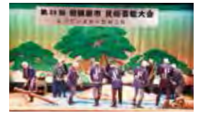
炭焼きの窯を築く時の仕事唄をうたっている様子