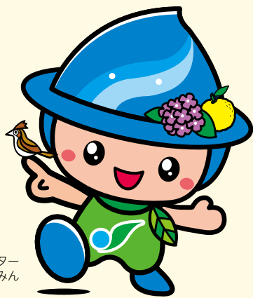
市マスコットキャラクター さがみん

さがみんが、子どもたちみんなに分かりやすく市のことを紹介するミン♪ 「さがみはら」に興味や親しみを持ってもらえるとうれしいのぉ。 調べ学習などにも、ぜひ活用してほしいミン♪