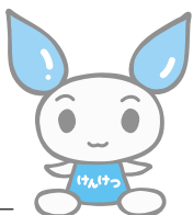
献血キャラクター けんけつちゃん