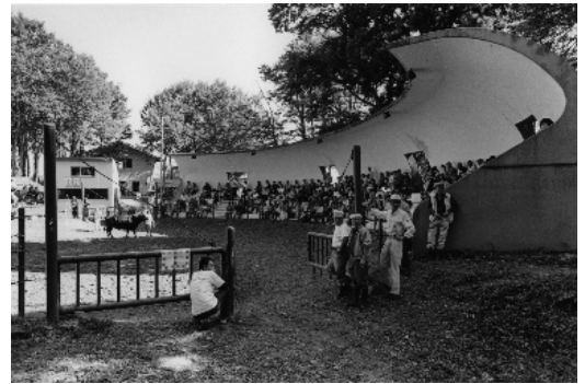
《Yamakoshi Niigata 2004.9》2005年

https://www.city.sagamihara.kanagawa.jp/kankou/bunka/1022300/gallery/index.html