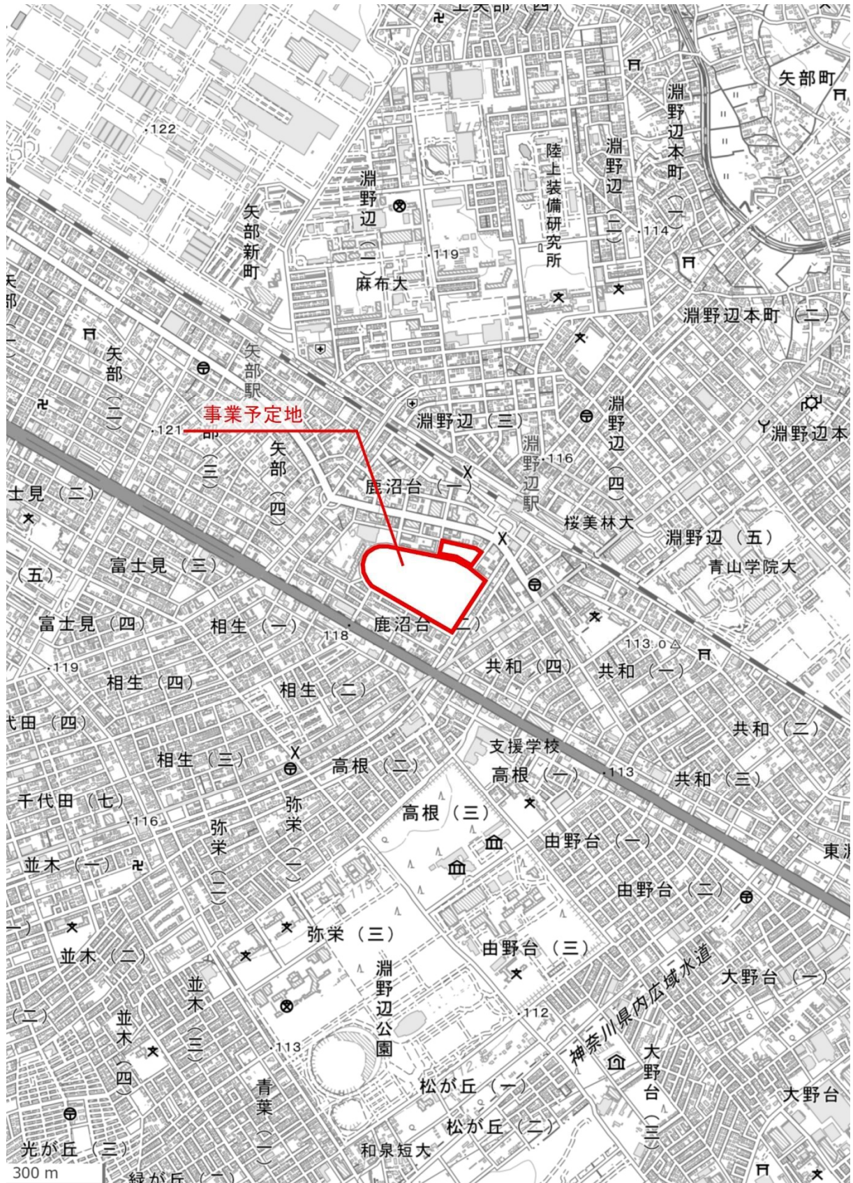
地理院地図（国土地理院）を基に作成