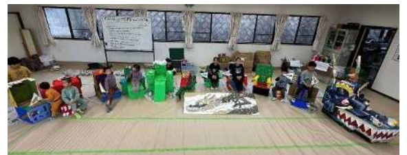
ドラゴンチェア:ダンボール箱でつくったドラゴンの胴体で、それぞれがイスになっている。

【問い合わせ】 アートラボはしもと 担当:柳川・土屋 ☎042(703)4654(水曜日休館)