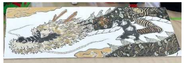
小原龍絵画:小原の石からつくった絵の具で描いた大きな龍の絵。