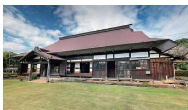
▶ 県指定重要文化財 小原宿本陣 (VRで公開予定)