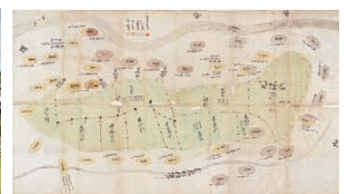
▶ 市指定文化財 相模野周辺三十六カ村入会絵図 元禄12年(1699)