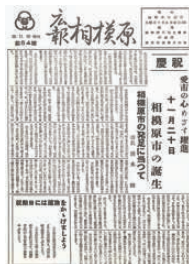
▶ 市制施行時の広報紙