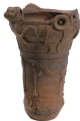
▶ 下原遺跡出土勝坂式土器