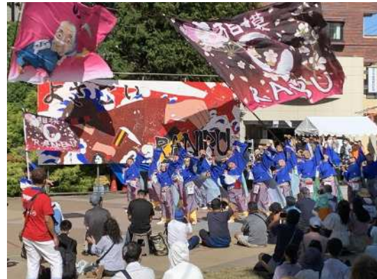
令和5年度開催時の様子