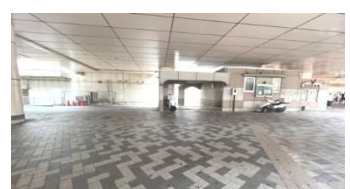
降りて左側に進む