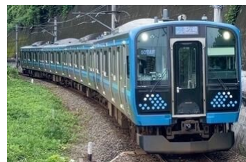
205 系と E131 系をモチーフにしたカプセルトイ

※参加費及び「相模の大風センター」への入館料は無料ですが、移動に必要な交通費およびスマートフォン等の通信料はお客様負担となります。