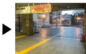
ペDESTリアンデッキに出る