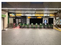
JR 橋本駅改札を右へ