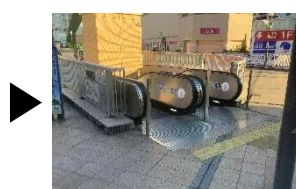
エスカレーターを下る