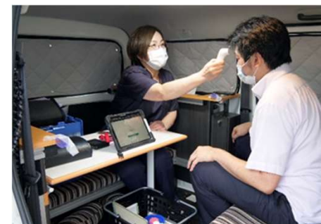
看護師による補助