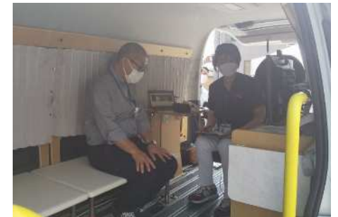
看護師による補助（イメージ）