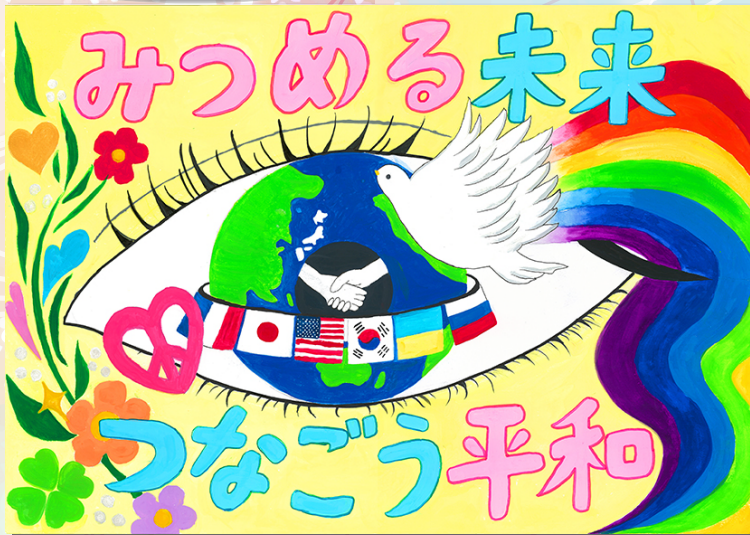
「みつめる未来 つなごう平和」