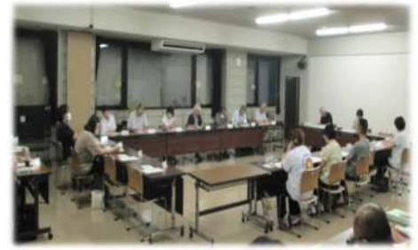
【検討協議会の様子】

これまでの検討経過 令和5年5月、城山地区小・中学校の保護者と地域の代表者を中心に、城山地区の子ども達にとっての望ましい学習環境の実現に向け、「 城山地区小・中学校の学習環境のあり方検討協議会 」を発足しました。これまで、8回の会議を重ね、現在は、特に児童数の少ない 湘南小学校のより良い学習環境のため 、活発な意見交換を行っています。