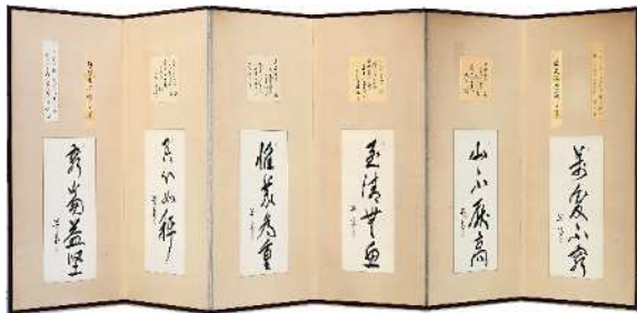
◀ 尾崎号堂 筆 屏風