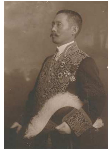
▲ 尾崎行雄 大正3(1914)年 司法大臣 在任時の大礼服姿