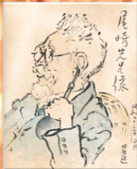
近藤日出造 画「尾崎先生像」