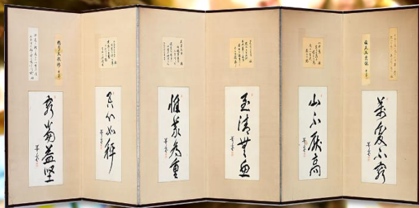
尾崎号堂 筆 屏風