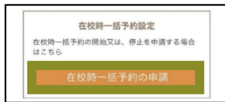
②在校時一括予約の申請