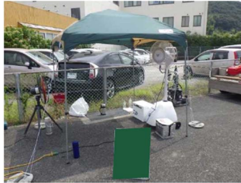
▲現場休憩所に日よけテント（ミスト扇風機）