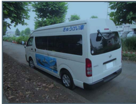
▲作業員休憩所から離れている箇所に休憩車を配置（車内にクーラーや温冷庫を設置）