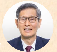
新型コロナウイルス 感染症対策分科会会長

差別や偏見、嫌がらせが広がると医療従事者やエッセンシャルワーカーの離職が増える可能性があります。また、感染者への同様のことが増えると検査を避けたり、感染を隠そうとする人が増え、感染拡大を抑えにくくなります。