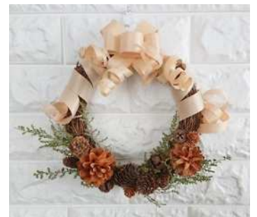
▲「Xmas リース」イメージ写真