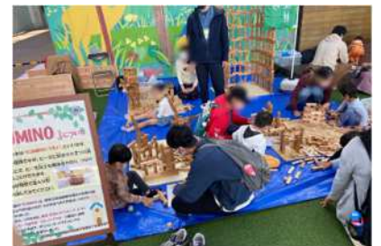
▲昨年度 KUMINO ひろばの様子