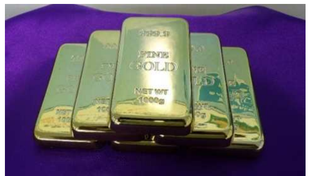
金のレプリカ (6kg相当)

*焼却炉の砂から貴金属を回収していますが、市民の皆様がごみを分別することでより効率的な資源の回収が可能です。ご協力をお願いいたします。