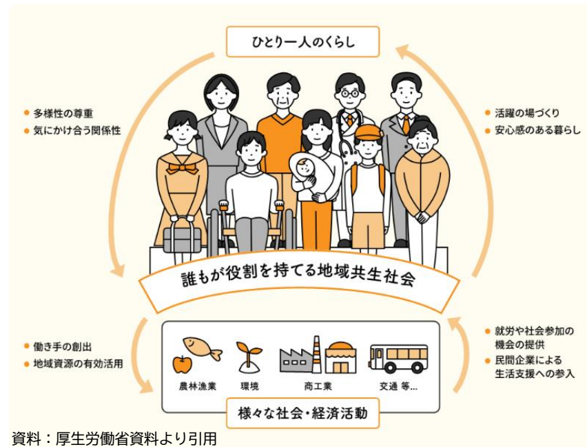
資料：厚生労働省資料より引用

制度・分野ごとの『縦割り』や「支え手」「受け手」という関係を超えて、地域住民や地域の多様な主体が参画し、人と人、人と資源が世代や分野を超えてつながることで、住民一人ひとりの暮らしと生きがい、地域をともに創っていく社会を指しています。