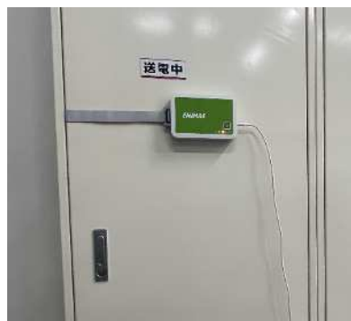
配電盤にポータブル通信電流計を設置（電気工事不要）

事業所内にポータブル通信電流計を設置して、電力消費量の測定を行い、電気を見える化します（10日間程度）。測定後、運用改善や省エネルギー設備導入のご提案をいたします。診断料は無料です。