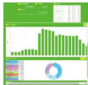
リアルタイムで電気量を測定