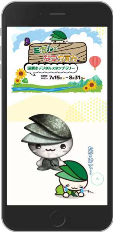
①「謎解きデジタルスタンプラリー」トップページ