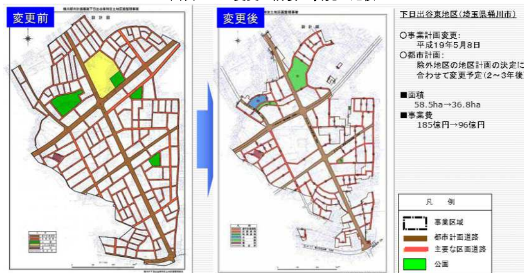
図表7-8 変更の前後の状況の比較

当該事例は、土地区画整理事業の長期未着手地区や事業停滞地区について、集約型都市構造への再編を進める上での必要性・緊急性の観点から、再点検と大幅な見直しが必要であるとして、根幹の公共施設の整備に重点を置いた事業区域等の見直しを行った。