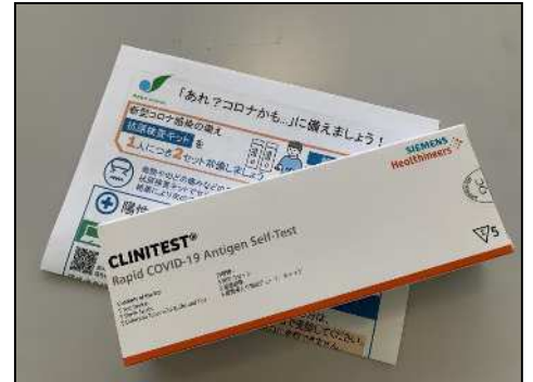
1箱5テスト分入っています。

令和5年1月9日（月・祝日）に開催する「令和5年相模原市はたちのつどい」の各区会場で、参加者に新型コロナウイルス感染症の抗原検査キットを無料で配布します。啓発チラシも同時にお渡しし、抗原検査キットの家庭常備の必要性や陽性が判明した際の対応を周知することにより、自分自身や大切な人を守るための対策の大切さを呼びかけます。