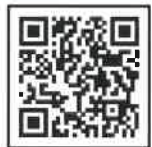
トライアル雇用制度 (求職者用)