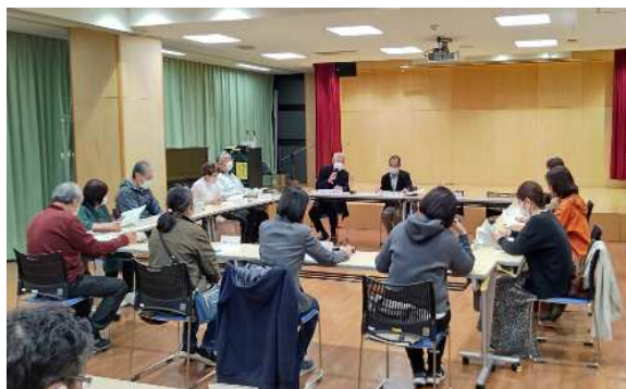
【4/27 検討協議会の一場面】

令和5年4月27日（木）に、第12回相武台周辺地域小・中学校の学習環境のあり方検討協議会（以下、検討協議会）を開催し、指定変更許可区域の検討について、今後の進め方の概ねの方向性を決定しました。