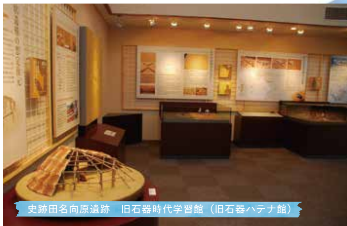
史跡田名向原遺跡 旧石器時代学習館 (旧石器ハテナ館)

昔の人々はどんな暮らしをしていたんだろう。 相模原にはどんないきものがあるんだろう。 宇宙ってどんな場所なんだろう。 中央区はさまざまな「学び」にあふれています。