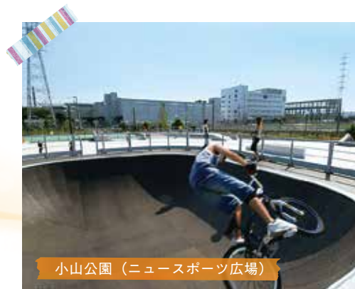
小山公園（ニュースポーツ広場）