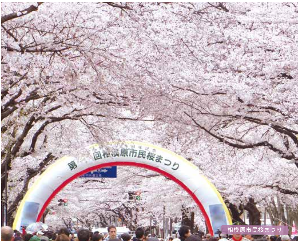
相模原市民桜まつり