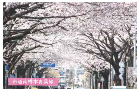
市道南橋本青葉線