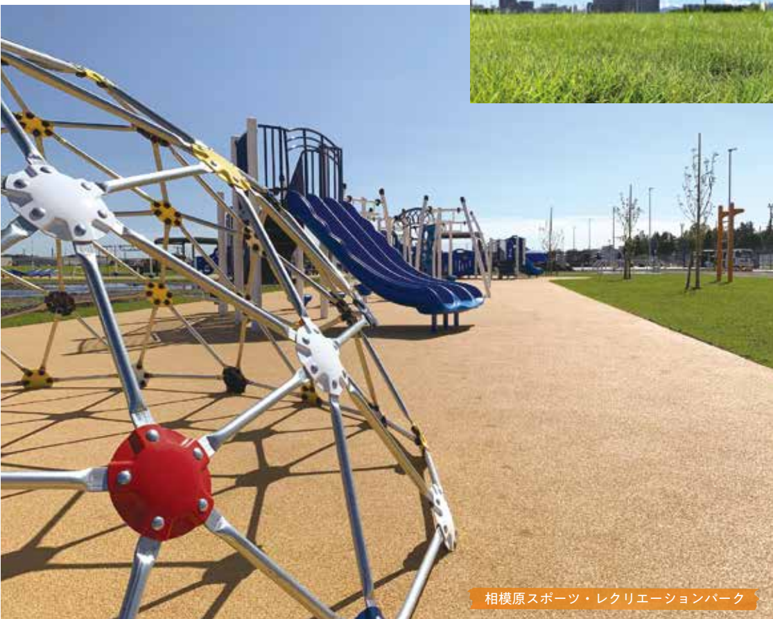
相模原スポーツ・レクリエーションパーク