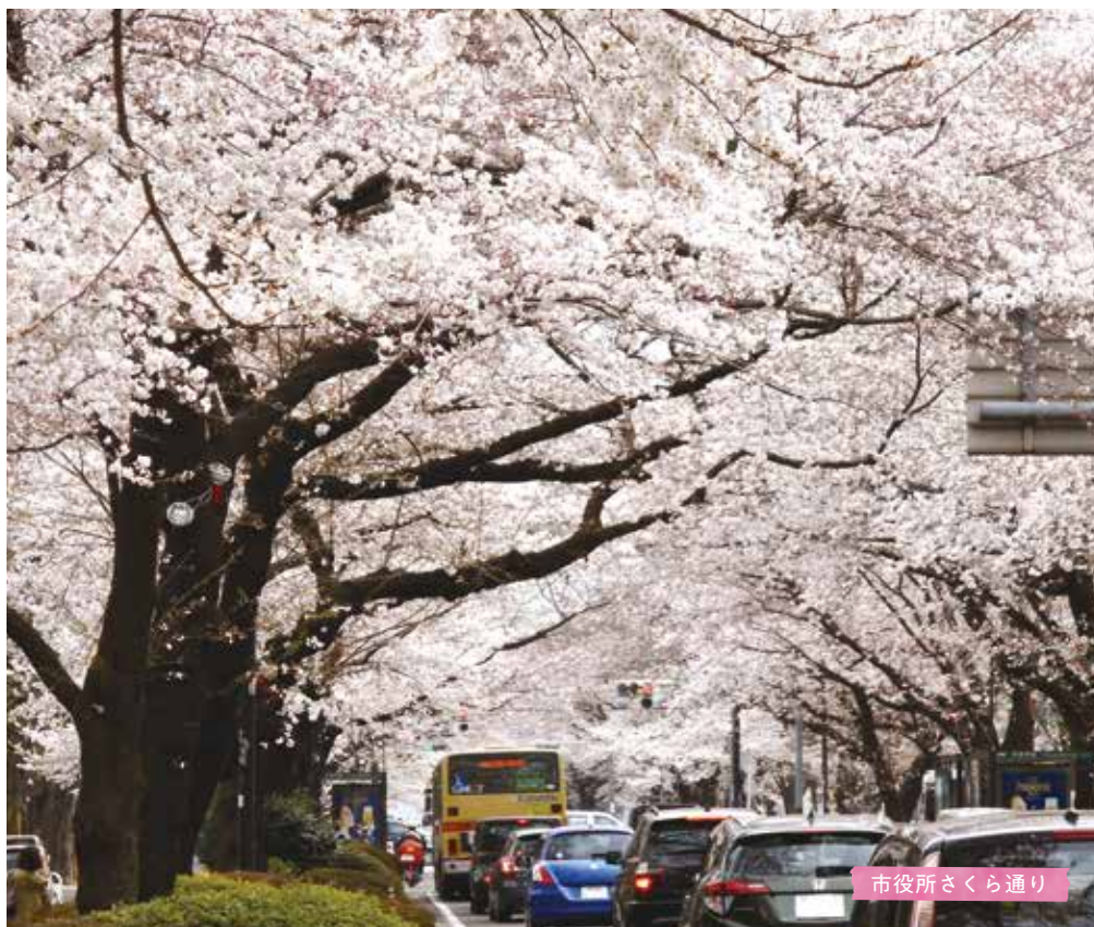
市役所さくら通り