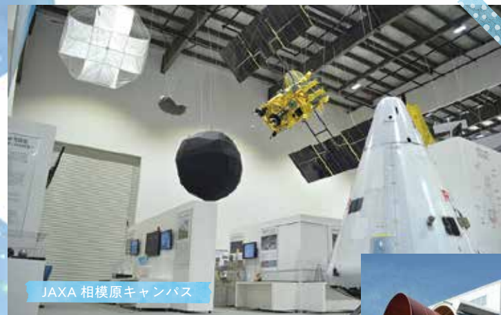
JAXA 相模原キャンパス