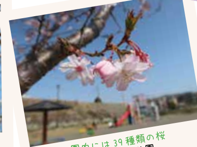
園内には39種類の桜 上溝さくら公園