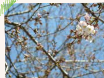
市の開花日の標本木 相模原消防署付近