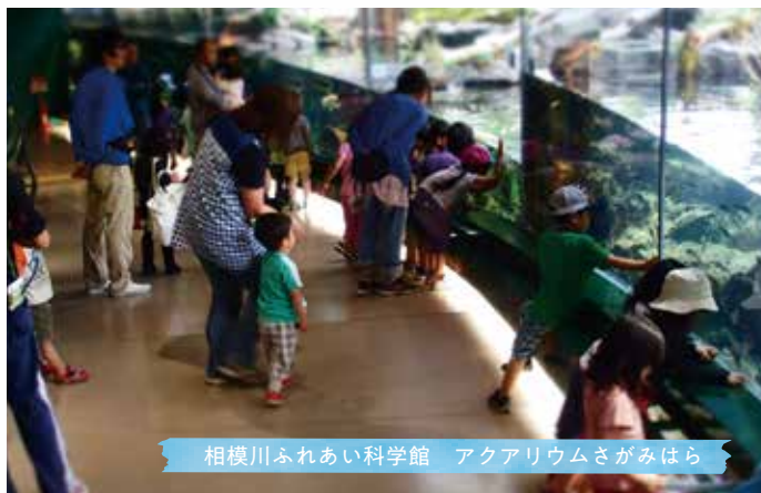
相模川ふれあい科学館 アクアリウムさがみはら