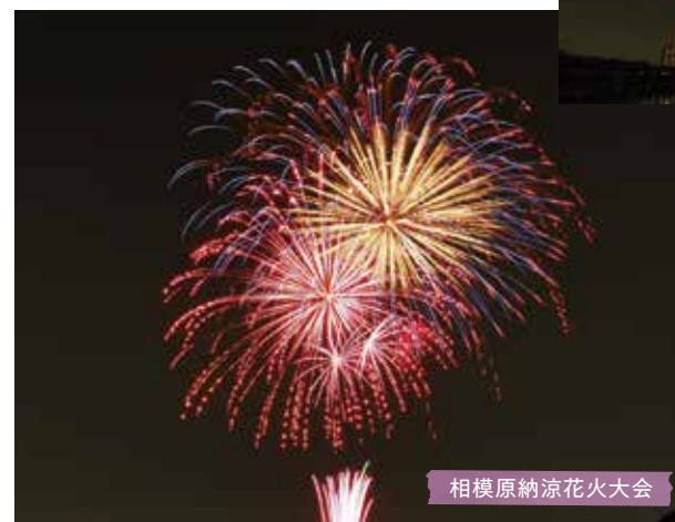
相模原納涼花火大会