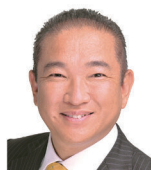
相模原市長 本村 賢太郎