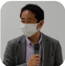
芝浦工業大学教授