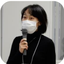
東京都立大学教授