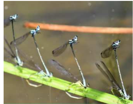
グランプリ作品「ソーシャルディスタンス」▶