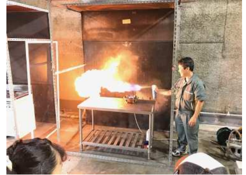
(過去の開催の様子)

市内の小学校高学年を対象に、工作、ゲームや国民生活 センターの施設見学を通じて、楽しみながら消費者として 必要な知識を身につけていただきます。市立弥栄中学校の 生徒さんにも講師のお手伝いをお願いします。