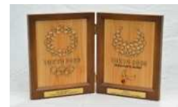
(記念エンブレム盾)