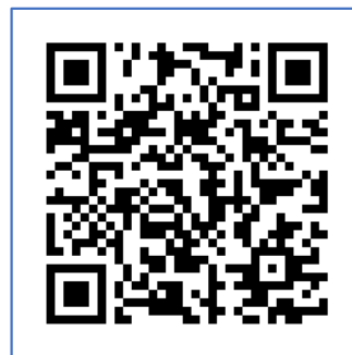
市ホームページ 里親制度