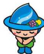
相模原市マスコットキャラクター 「さがみん」