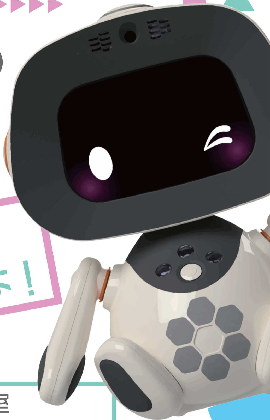
コミュニケーションロボット unibo(ユニボ)

※当イベントでは、劇場、音楽堂等における新型コロナウイルス感染拡大予防ガイドラインに準じて感染対策を行っております。※37.0度以上の発熱がある方、体調の優れない方、咳のある方のご参加はお断りさせていただきます。※当日の天候・交通事情・感染状況により、時間・場所・内容が変更になる場合がございます。あらかじめご了承ください。