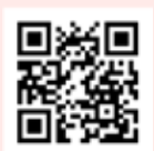
博物館ホームページ

相模原市中央区高根3-1-15 TEL 042-750-8030 https://sagamiharacitymuseum.jp