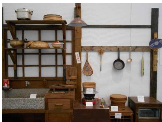
電化製品普及前の台所