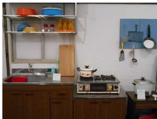
電化製品普及後の台所