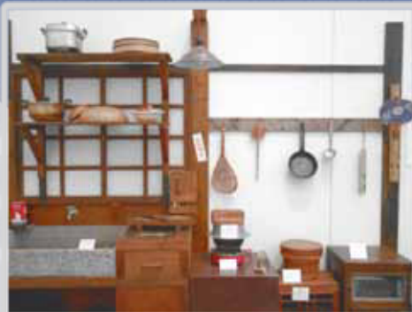
電化製品普及前の台所