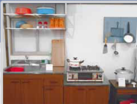
電化製品普及後の台所