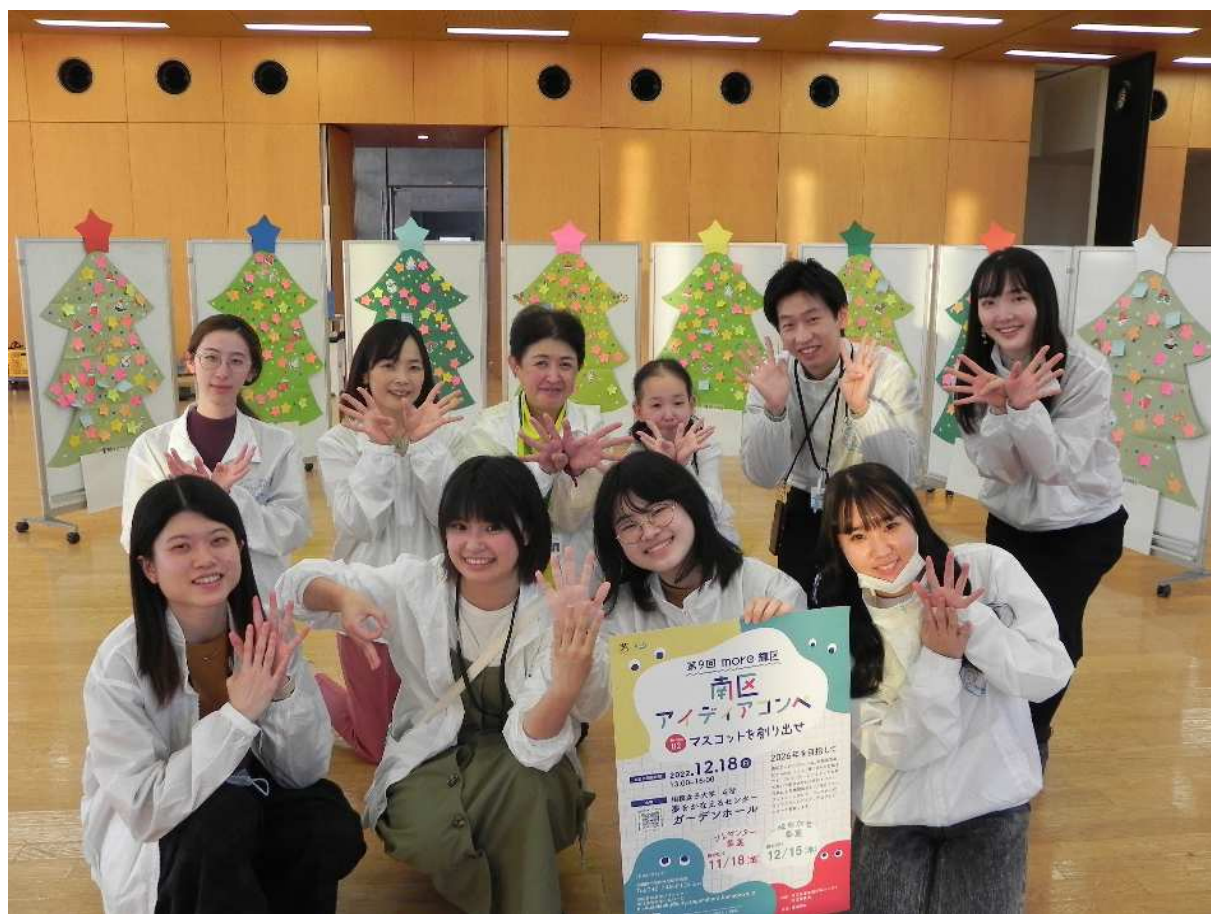
実行委員集合写真（閉会后：会場にて）

若い世代が、まちづくりへ参画しやすい方法を若者自らが企画・実施することを目的としており、南区の特徴的な事業である無作為抽出型区民討議会の参加者、区内大学生、元南区区民会議委員の有志などが立ち上げに関わりました。