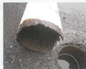
ポール看板の倒壊

早めに処置すれば、サビを落とし保護材を塗布すれば済むものも、放っておくと取替えや大規模補修により 多額の費用 がかかり、事故が発生した場合は 賠償責任 を問われることもあります。