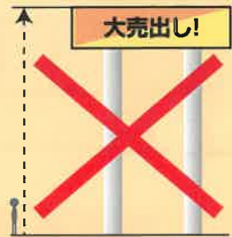
高すぎる独立広告