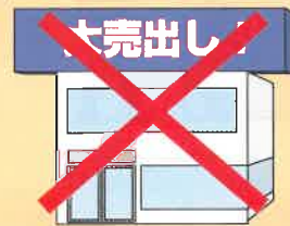
建物からはみ出す屋上広告

地域ごと（商業地・住宅地・国県道沿道など）に、掲出できる面積や高さなどの基準があります。また、一部地域には、地色の制限があります。付け替えるときも、基準を守る必要があります。