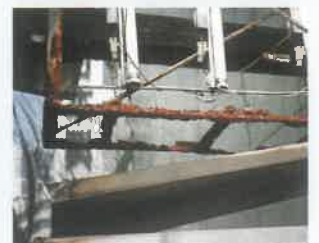
袖看板の底部脱落