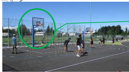
バスケットゴール (スポレク) 写真

バスケットゴールの高さを変更 (大人用1基、子ども用1基) ⇒ (子ども用2基)