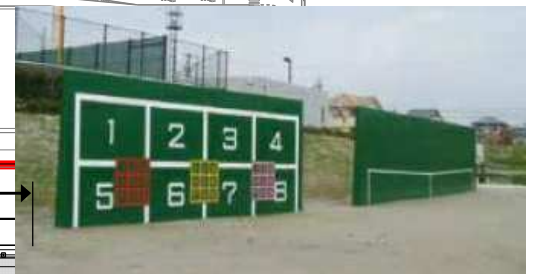
スポーツウォール写真 (参考例)