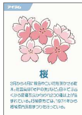
(アイテムカード) ～全68種類～