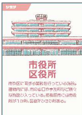
(公共施設カード) ～全25種類～

市の公共施設が描かれた「公共施設カード」、様々な「アイテムカード」及び「マネジメントカード」を使って、市の抱える課題を解決に導くためのアイデアを考えるゲームで、“より良い・より面白い”アイデアを考え、支持を集めたプレイヤーが勝者となります。