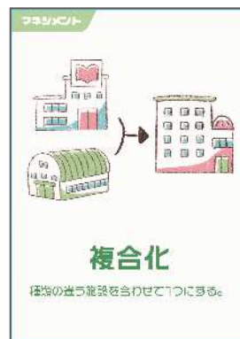
(マネジメントカード) ～全15種類～