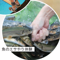
魚のエサやり体験