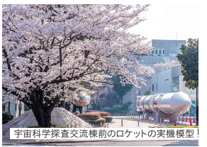
宇宙科学探査交流棟前のロケットの実機模型！