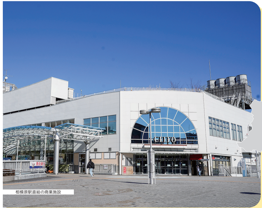
相模原駅直結の商業施設

相模原駅周辺は商店や飲食店が充実しています。地元ならではの商店で買い物したり、駅北口周辺にある様々なスポーツを楽しむことができる相模原スポーツ・レクリエーションパークで遊んだり、多くの人々にぎわっています。