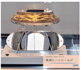
「はやぶさ」再突入時の「背面ヒートシールド」