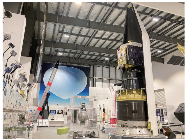
宇宙科学探査交流棟 内部の様子