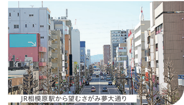
JR相模原駅から望むさがみ夢大通り