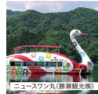
ニュースワン丸(勝瀬観光株)