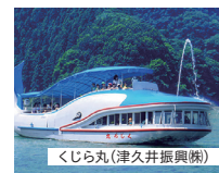
くじら丸(津久井振興協)