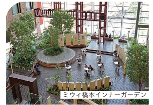
ミウイ橋本インナーガーデン