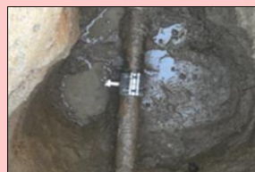
漏水している水道管

漏水や機械の設備故障は突然起こり、断水する恐れもあるため、早急な現場対応が必要となります。また、夜間休日でも異常をいち早く察知できるように、スマートフォンで確認できる監視システムを活用しています。