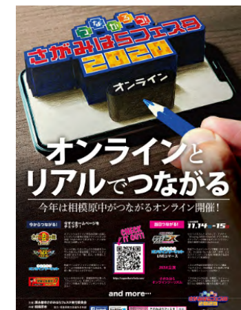
ポスターイメージ

参加方法 ：ユーザーは無料で公開されたイベントサイトへ訪問し動画の視聴や投票、体験ができる