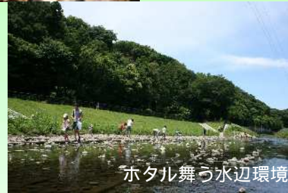
ホタル舞う水辺環境

市では、保全等活動区域内の自然環境を保全するため、所定の許可を受けずに上記の行為をした場合は、行為の中止や原状回復の勧告を行います。それでも従わないときは、氏名等を公表する場合があります。