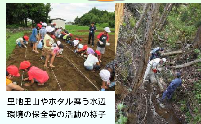
里地里山やホタル舞う水辺環境の保全等の活動の様子