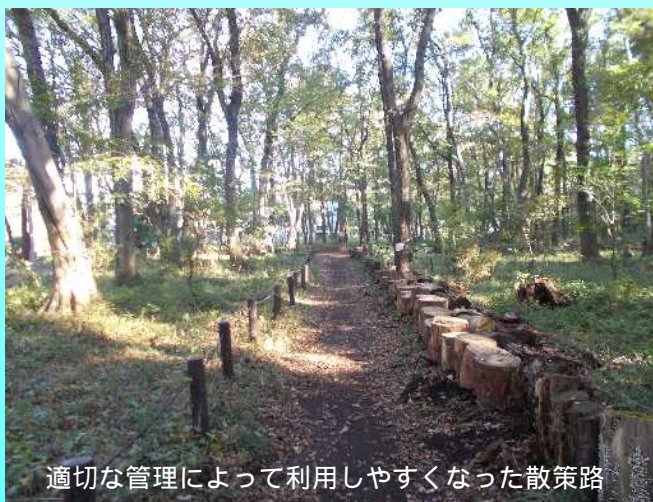
適切な管理によって利用しやすくなった散策路

本市には、手つかずの原生林や都市部に残る貴重な樹林地など、様々なみどりがあります。市では、保全団体等と協働しながら、緑地や緑化施設の態様に応じて、総合的かつ計画的な保全に努めています。