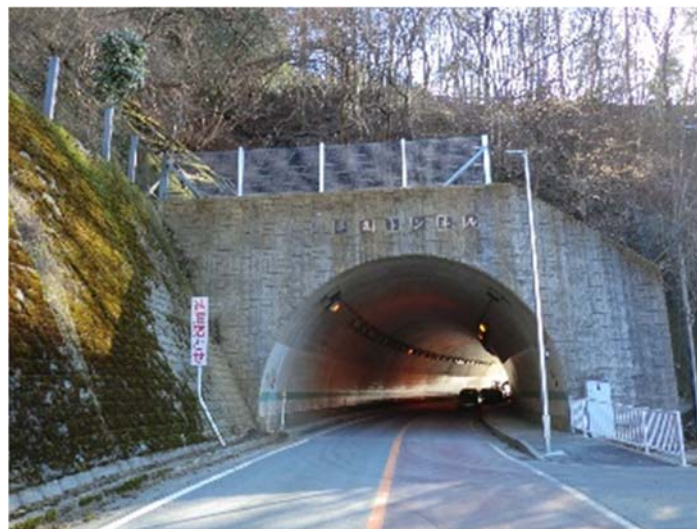
⑤ ひらまる 平丸トンネル手前【復旧完了】