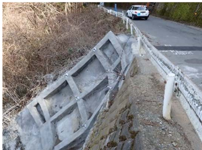
⑦ よこやま 横山橋手前【復旧完了】