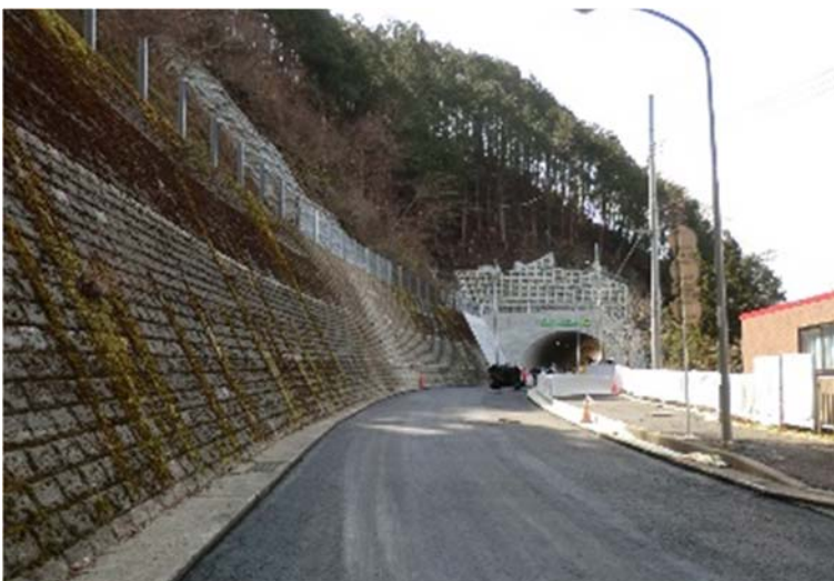
⑥ よこやま 横山トンネル手前【法枠工、既設法枠補修工】