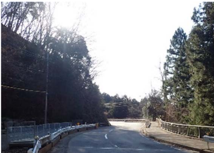
② こと さわ 琴の沢橋【高欄設置工】