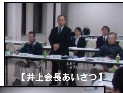
【井上会長あいさつ】