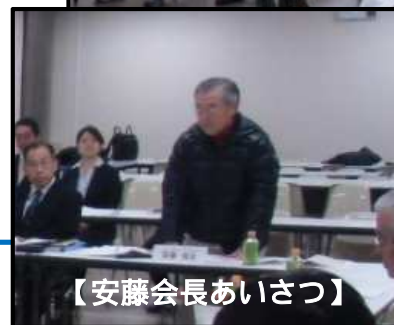
【安藤会長あいさつ】