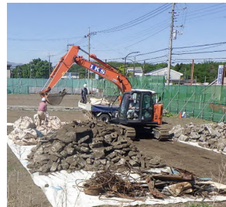
【仮置き土移設分別工事】