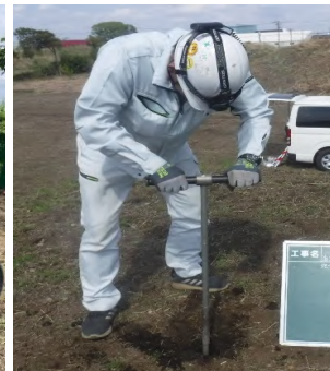
【仮置き土汚染調査】